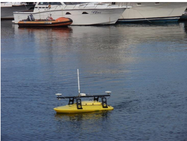
フィールドデモンストレーション ②