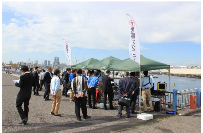
フィールドデモンストレーション ①