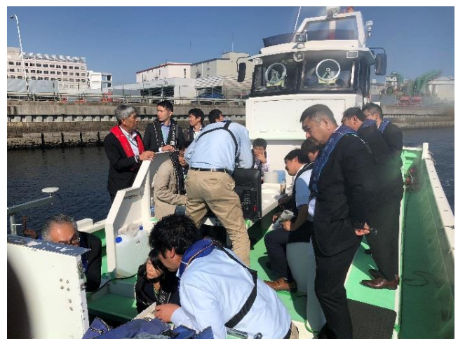
フィールドデモンストレーション ③