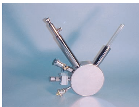
クライオスタット