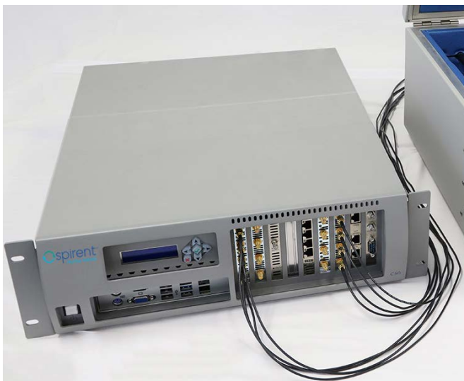
STC 11ax 対応 C50 アプライアンス外観

※2 複数ベンダーの Wi-Fi 6 対応 AP および 2.5/5G Ethernet インタフェース接続による性能評価/結果比較を実施することにおいて国内初(東陽テクニカ調べ)