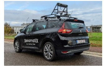
路面性状計測システム「TN-Twin Tracker」