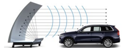
IoT・小型モビリティ無線通信評価