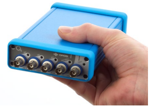
プラグアンドプレイ 4ch FFT アナライザ O4 (OROS 社)