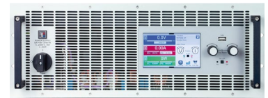
電力回生式・双方向 DC 電源 (EA Elektro-Automatik 社)