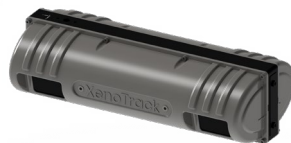
路面性状計測システム 「TN-Twin Tracker」 (東陽テクニカ)