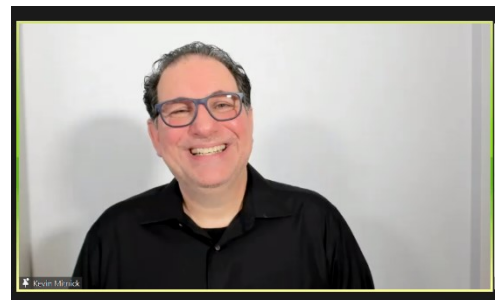
オンラインで講演する Kevin Mitnick 氏

そして、Kevin Mitnick 氏は、ハッキングを今も常に行っている—それはクライアント(企業)に依頼を受けた、セキュリティの脆弱性を確認するための侵入テストで、侵入率は100%を保っていることから、企業が犯罪者に狙われる可能性は常にあることを呼びかけました。また、コロナ禍により急速に拡大したリモートワーク環境ならではの脅威や、より巧妙化するフィッシング詐欺について、デモンストレーション