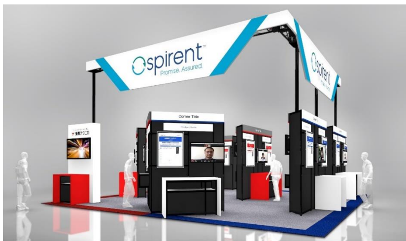
出展ブースイメージ

また、今回の「Interop Tokyo 2021」の Best of Show Award ファイナリストとして、東陽テクニカの8つの製品・ソリューションが選ばれました。受賞については14日に発表される予定です。