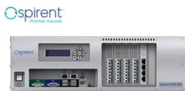
LTE/5G モバイルコアネットワークテスター 「Landslide 5GC Automation Package」