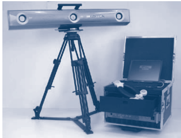
ベルギー KRYPTON社製 3次元位置計測システム K600 CCDカメラ技術を応用した3次元位置（座標）計測システムです。静止している物体の位置だけではなく、ロボットなどの速い動作をする物体の位置までも高精度に計測することができます。